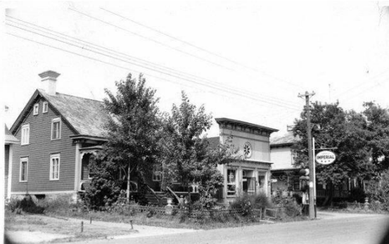
MAGASIN GÉNÉRAL DE ST-PROSPER